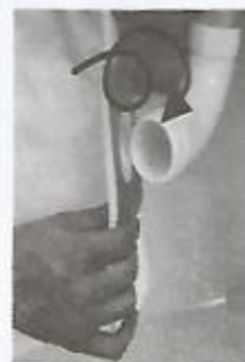
Eldobható porzsák felhelyezése

évente egyszer cserélni, amennyiben a főszűrő szakadása, esetleges eltávolítása miatt következik be a meghibásodás, az garanciában nem érvényesíthető!